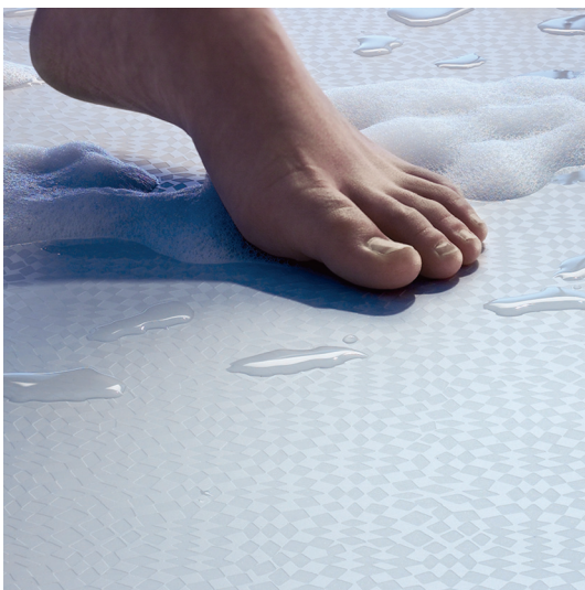
- Vollflächige Rutschhemmung Oberfläche: Safe -

Neben der klassischen Acryloberfläche bieten wir eine komfortable Alternative an. Safe.